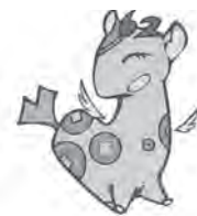
個人住民税PRキャラクター ぜいさいん